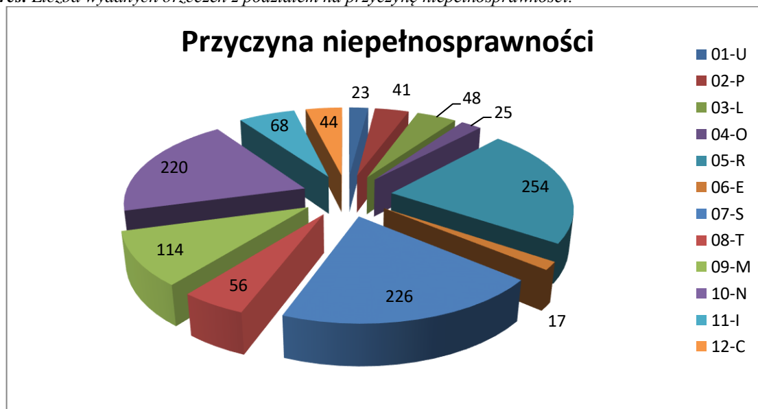
Wykres. Liczba wydanych orzeczeń z podziałem na przyczynę niepełnosprawności.