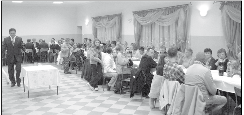
Szampana podano.

Oficjalna część uroczystości była pełna entuzjazmu, na poczęstunku nie zostałem, choć gościnni mieszkańcy Rychnowa zapraszali do stołu.