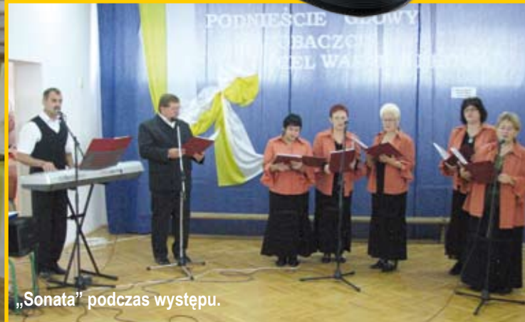
„Sonata” podczas występu.