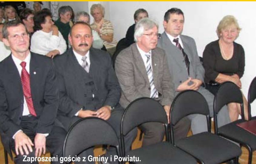
Zaproszeni goście z Gminy i Powiatu.