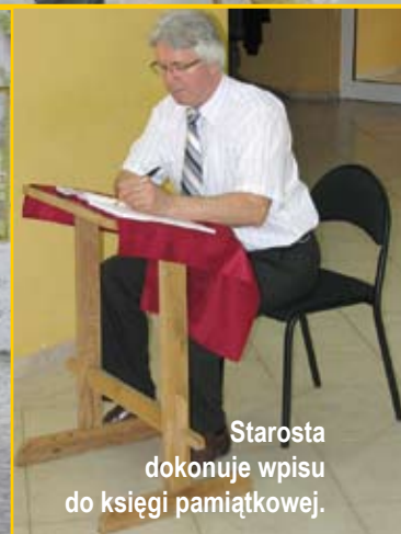
Starosta dokonuje wpisu do książki pamiątkowej.