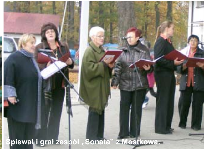
Śpiewał i grał zespół „Sonata” z Moskwa.