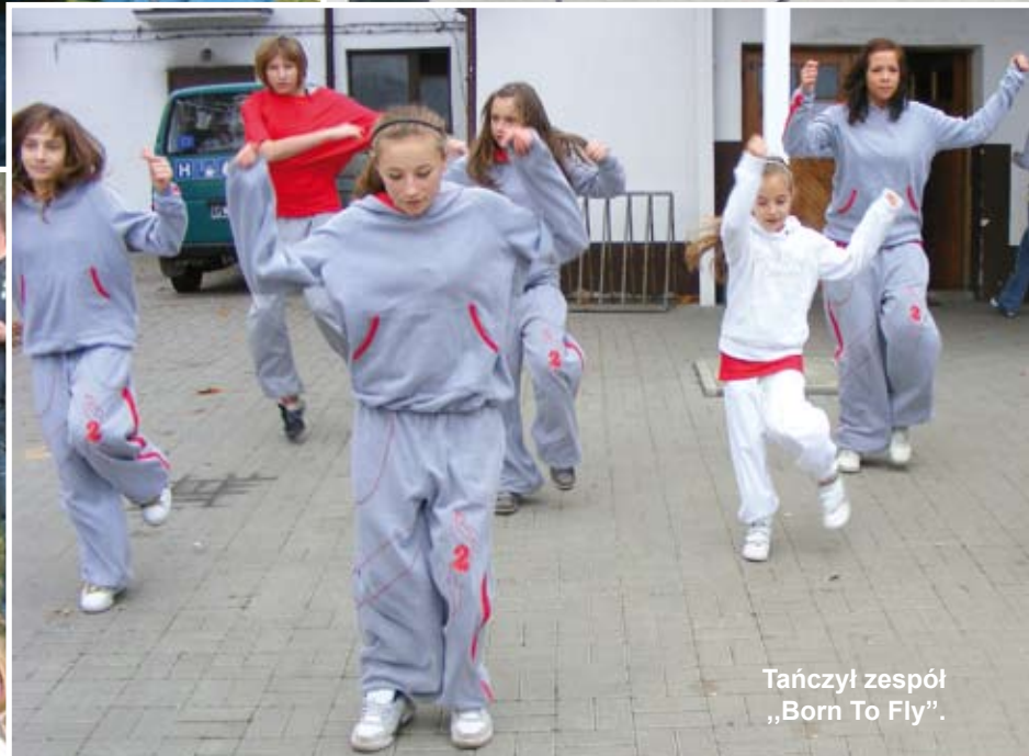
Tańczył zespół „Born To Fly”.