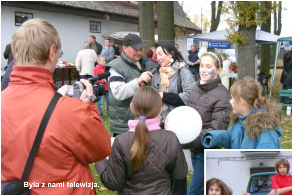
Była z nami telewizja.