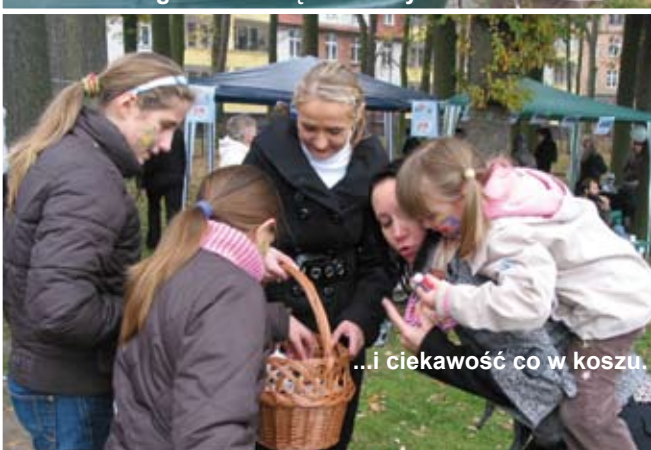
...i ciekawość co w koszu.