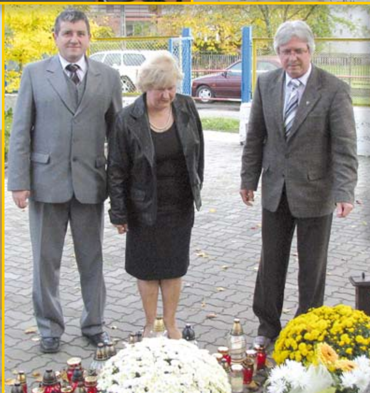
Podczas złożenia kwiatów przed szkołą.