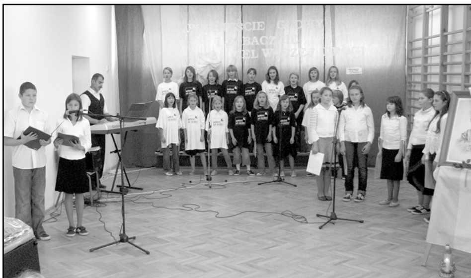
Zespół „Promyczki” podczas występu.

Cieszy, że szkoła ma swoją tradycję, którą potrafi się zgrabnie chwalić i wykorzystuje potencjał aktywnych osób.