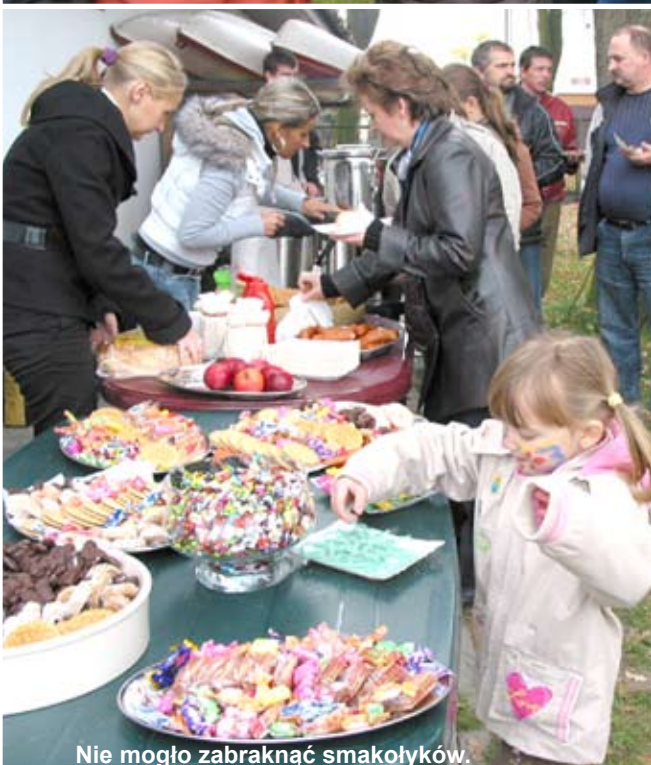
Nie mogło zabraknąć smakołyków.