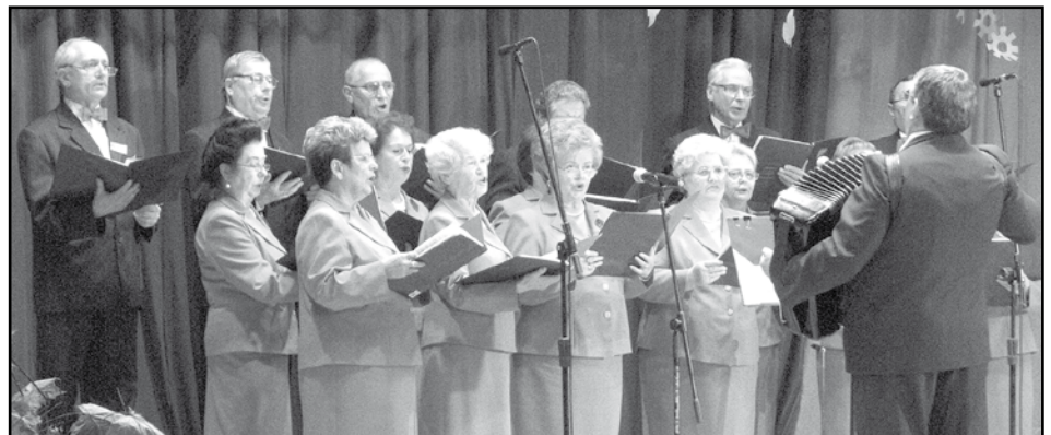
Roztańczone „Uśmiechy.” I zespół „Retro” w czasie występu.