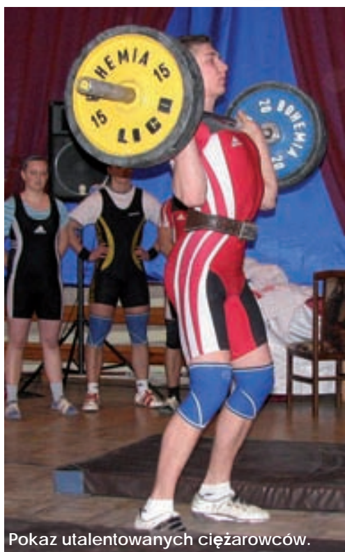
Pokaz utalentowanych ciężarowców.