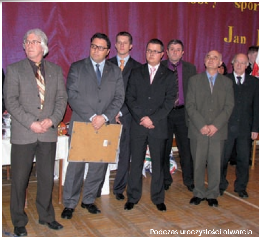
Podczas uroczystości otwarcia