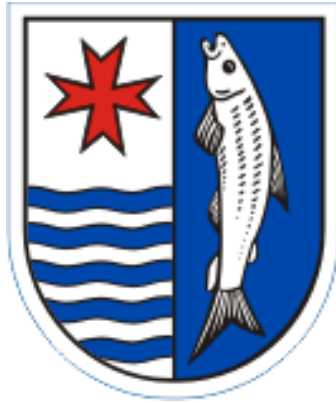
HERB POWIATU MYŚLIBORSKIEGO