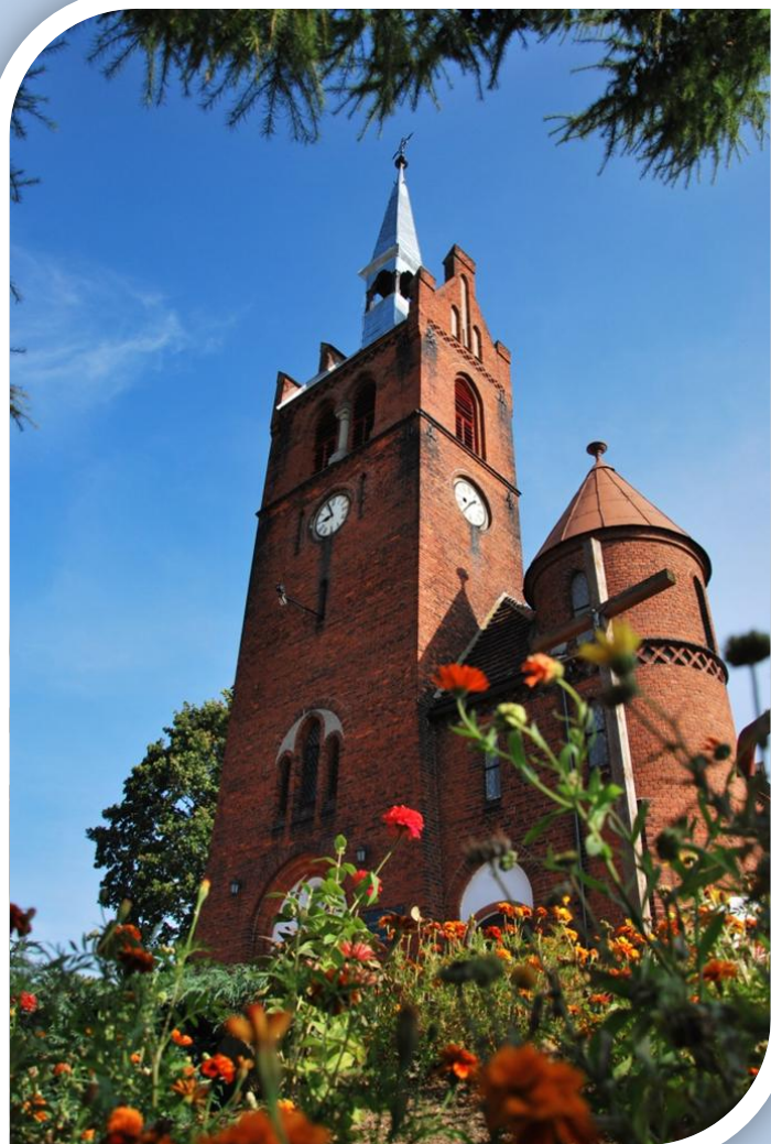
Kościół pw. św. Józefa w Trzcince