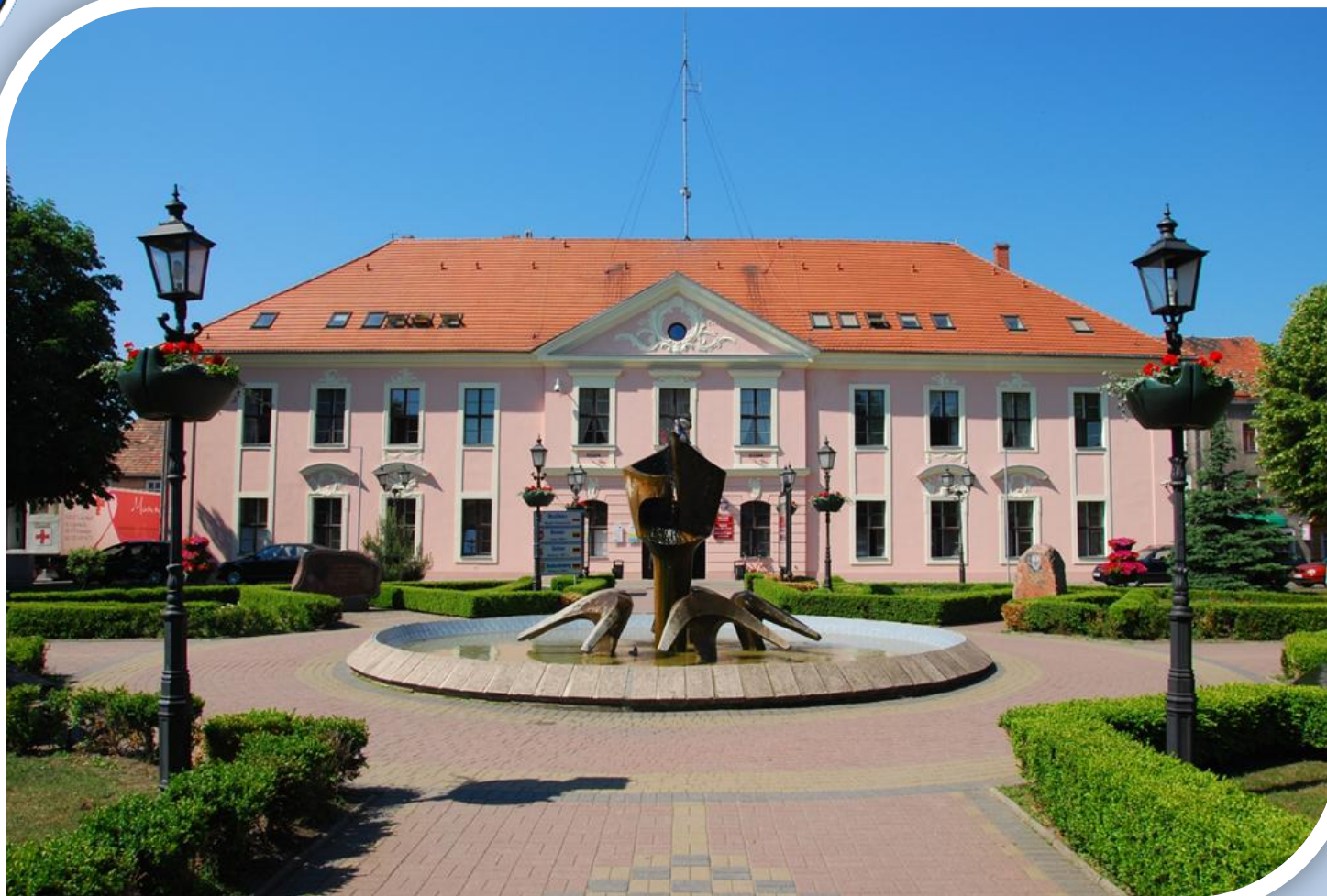
Późnobarokowy ratusz w Myśliborzu